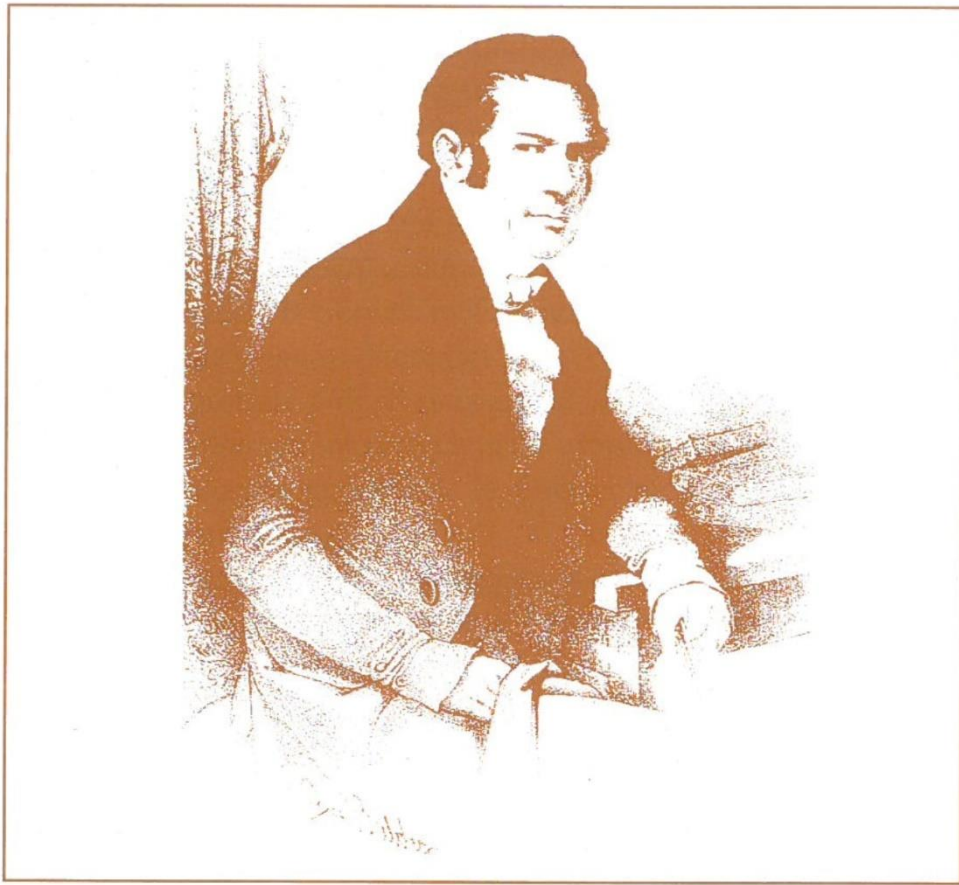
Johann Lucas Schönlein.

Fra i padri della microbiologia cutanea, dobbiamo ricordare l'ungherese David Gruby , nato il 20 agosto 1810 e morto a Parigi il 16 novembre 1898. Studia medicina a Vienna ed è un tipico esempio di medico ricercatore che trova la sua strada nel nuovo campo della nascente istologia. Si dedica infatti allo studio della morfologia dei tessuti e dei liquidi patologici.